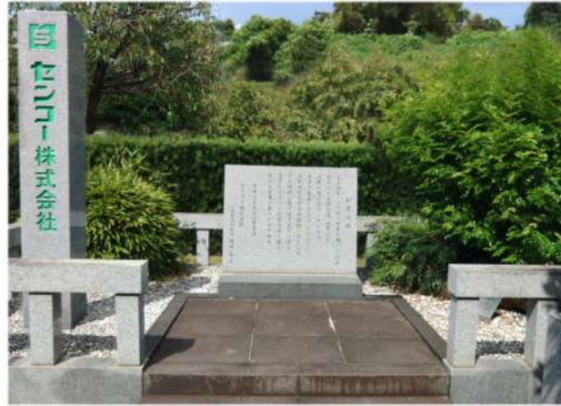
『センコー創業の碑』 富田商会水俣出張所跡地

地域社会へも貢献できる存在として、私たちはこれからも物流サービスの品質向上に取り組んでまいります。